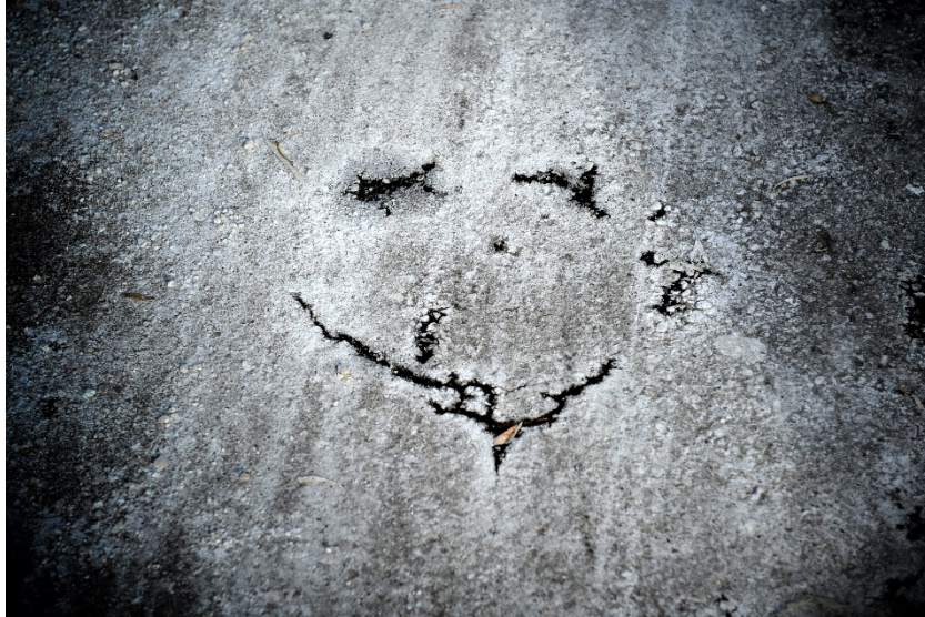
Luonto voi saada sinut hymyilemään

Loppuvuosi on valokuvausalalla hieman hiljaisempaa, joten Teemu on käyttänyt vapaan ajan hyödyksi ja hionut omia taitojaan vielä paremmiksi. Myös kalustoa on päivitetty jatkuvasti parempaan.